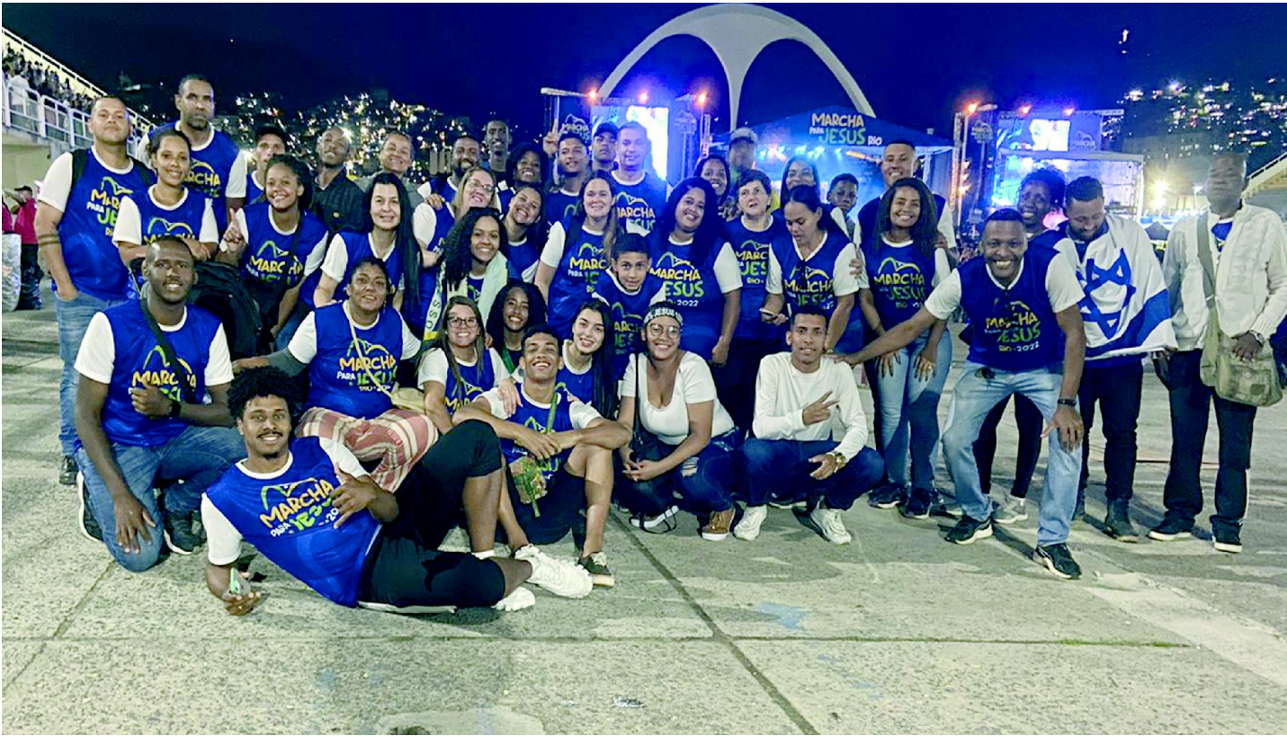
ADVEC Macuco - Assembleia de Deus Vitória em Cristo - participou da Marcha para Jesus.

A Marcha para Jesus, no Rio de Janeiro, ficou sem atividade por 7 anos. Com o retorno neste sábado, 13 de agosto, o evento completou 30 anos, reuniu milhares de fiéis no Centro da cidade, sendo iniciado a partir das 14h, na Av. Presidente Vargas até à Praça da Apoteose, local onde foi realizada a apresentação de renomados cantores da música gospel.