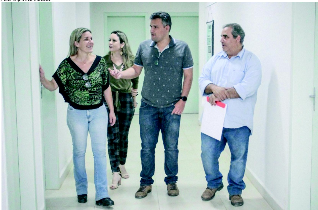
Ao lado da subsecretária de Saúde, do secretário de Governo e Gestão e do responsável pela empresa, a prefeita de Macuco visita as instalações do hospital

Um encontro idealizado pela prefeita do município, comprovando que a união de esforços de profissionais das áreas financeira, de administração, saúde e construção civil faz aumentar consideravelmente a cada dia as chances de conseguir finalmente retirar do papel aquele que é considerado o maior sonho de gestores e população macuquense.