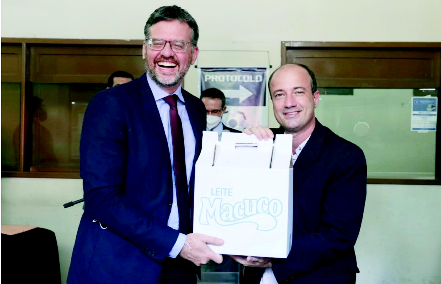
O defensor público Geral do Estado do Rio de Janeiro - Rodrigo Pacheco e o prefeito Bruno Boaretto.

Nesta sexta-feira, dia 18, foi inaugurado em Macuco, o Posto Avançado da Defensoria Pública do Estado do Rio de Janeiro. Com os serviços dessa instituição jurídica ao alcance de todos, os macuquenses ganham comodidade