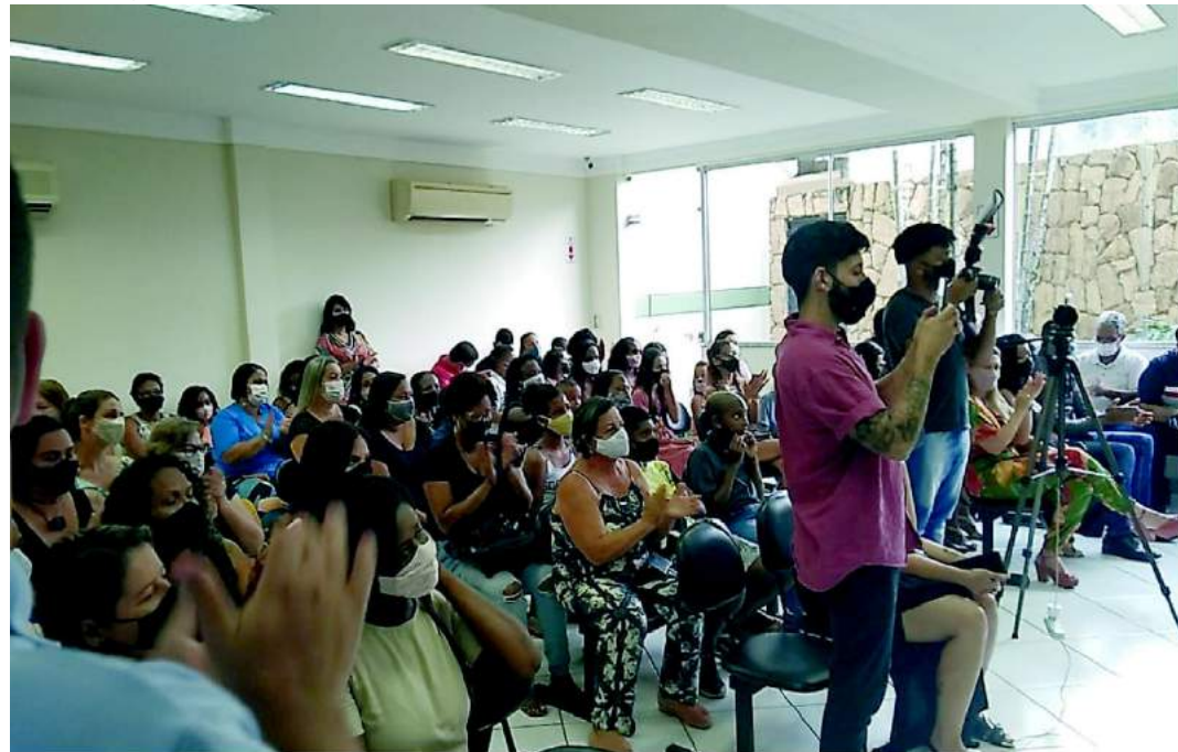
Familiares, professores, diretores e autoridades municipais presentes à cerimônia.