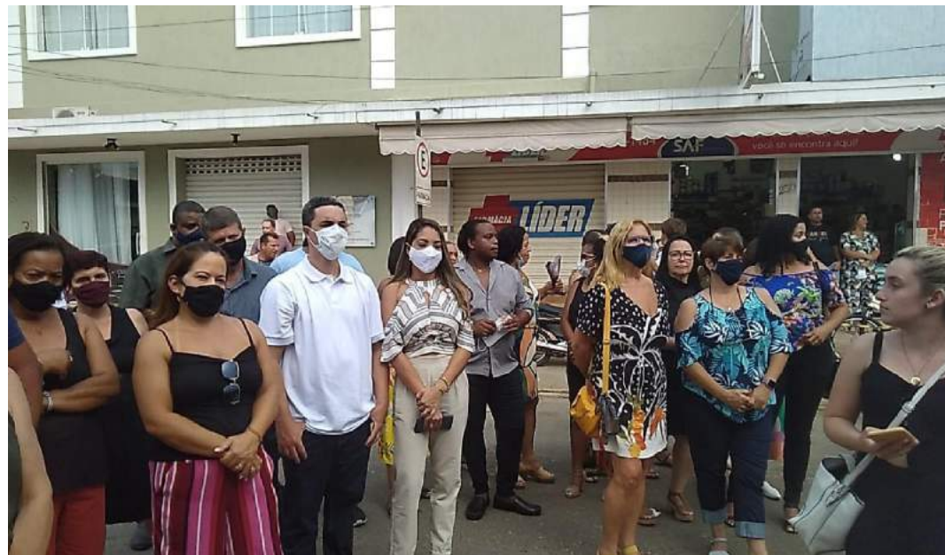
Parte do público presente durante a inauguração.