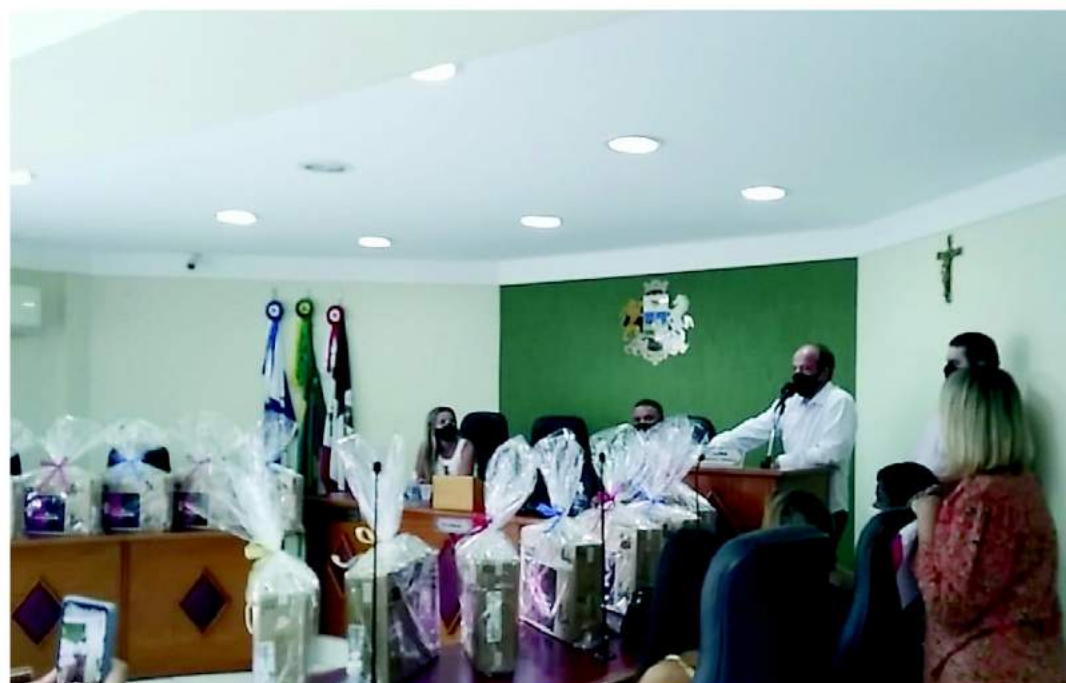
O prefeito municipal Bruno Boaretto frisa o papel fundamental da interação entre escola e família.