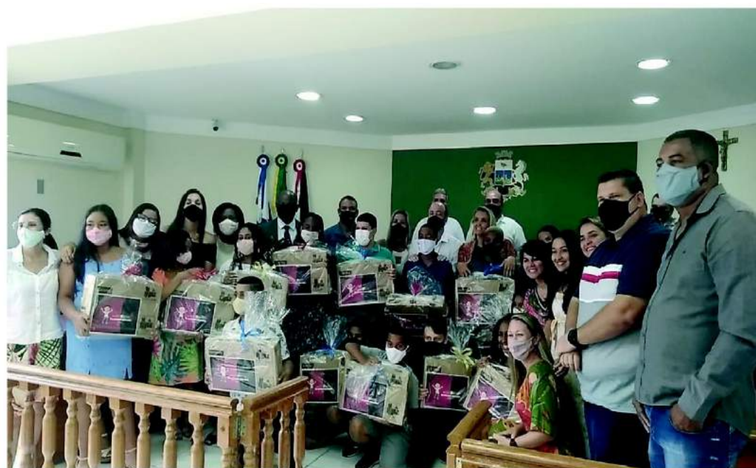
Alunos premiados junto aos seus professores e autoridades municipais.