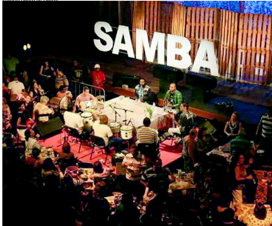
Imagem: Banco de Dados