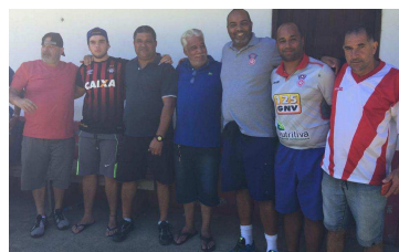
Organizadores e equipes de futebol celebraram o evento esportivo na cidade