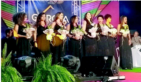
Oito participantes disputaram o título de beleza macuquense