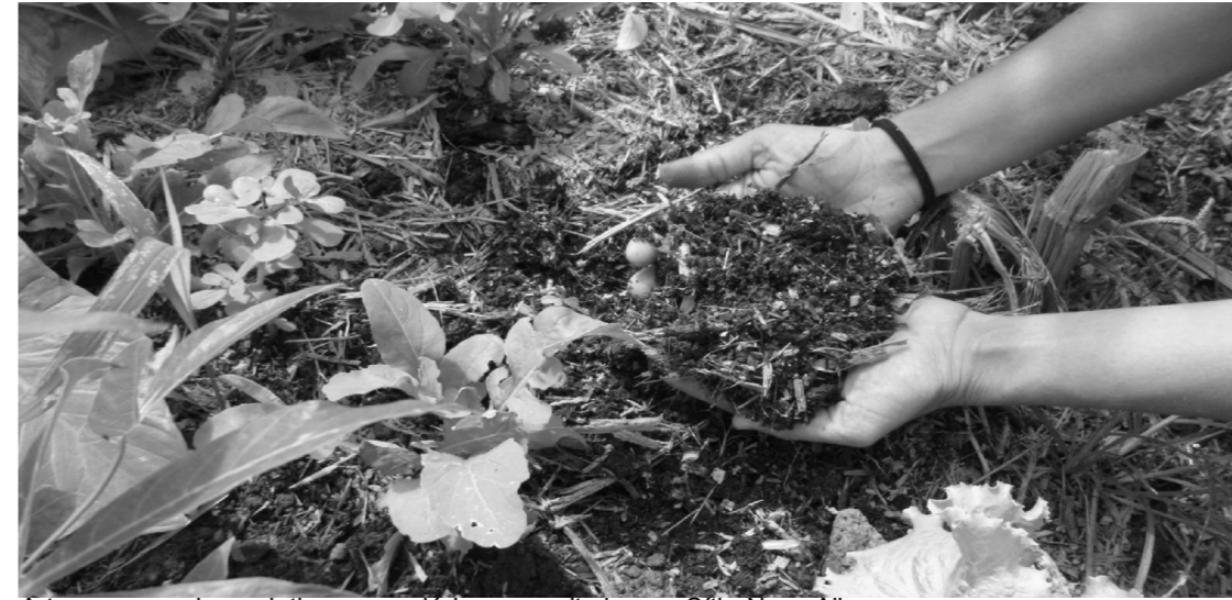
A terra seca e improdutiva agora dá bons resultados no Sítio Nova Aliança