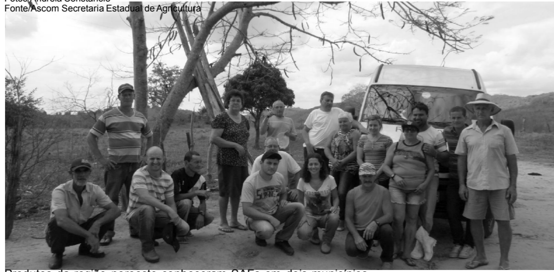
Produtos da região noroeste conheceram SAFs em dois municípios